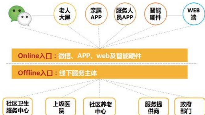
图 2 三层服务体系