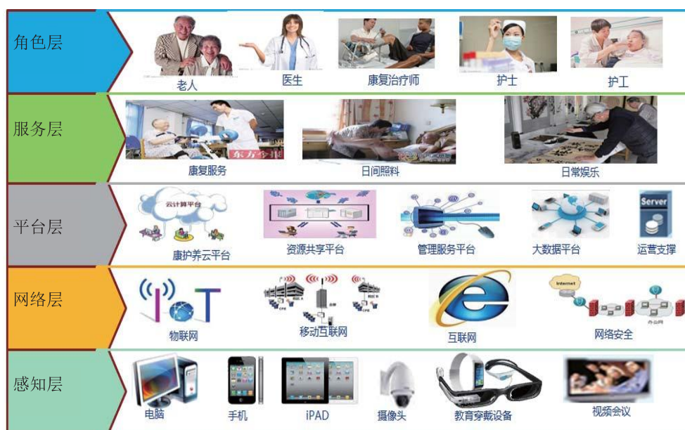
图3 网络平台整体架构

提供日常生活照料服务。(2) 服务层：老年康复服务分为传统的康复服务与现代的康复服务、日间生活照料与医疗护理服务、老年人的常见的慢病监测与医疗服务。(3) 平台层：负责整个业务的实现，包括云平台服务业务的支撑、资源共享平台负责资源的对接与分发、管理平台负责业务的管理、运营支撑负责日常维护与报表、大数据平台负责数据存储与挖掘服务。(4) 网络层：平台通过互联网、移动互联网、物联网等网络方式进行通道服务。(5) 感知层：主要提供服务接入的终端设备与开展治疗和监测的医疗级器械，见图3。